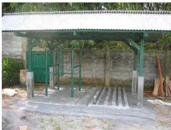
Gambar 7. Kandang Jepit penghandling sapi

Pemotongan kuku terutama diperuntukkan pada ternak yang terus menerus dipelihara di dalam kandang. Sapi yang dipelihara terus menerus di dalam kandang akan memiliki kuku yang tidak normal. Kuku tumbuh panjang dan memiliki bentuk yang tidak bagus, serta dapat dijadikan sebagai tempat berkembangbiaknya bibit penyakit. Kuku yang panjangnya berlebihan mengakibatkan tekanan pada teracak tidak merata, tepatnya tekanan tidak menyebar ke seluruh kaki dan titik berat tubuh bergeser. Hal ini membuat sapi menjadi tidak nyaman dan tidak seimbang saat berjalan. Ketidak yamanan membuat sapi tercekam sehingga bisa menurunkan produksi susu, sedangkan kepincangan menyebabkan sapi betina tidak dapat menerima pejantan bila dikawinkan secara alamiah.