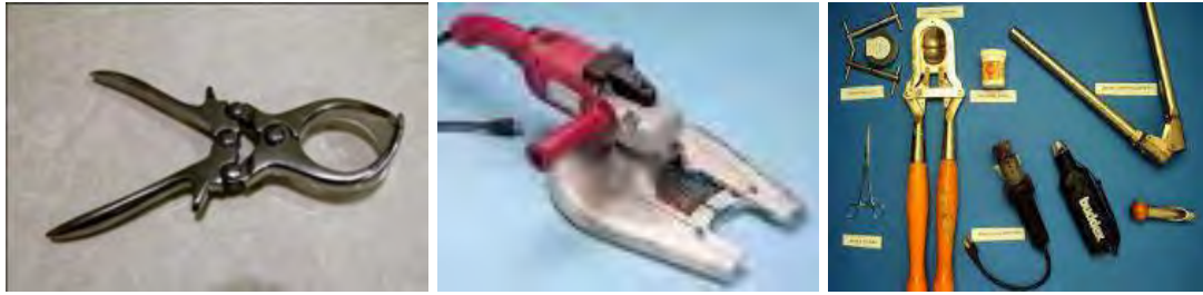
Gambar 15. Peralatan Dehorning

Pemberian Marka atau Penandaan ( Marking/Branding ). Pemberian Marka ( marking/ branding ) merupakan salah satu cara untuk melakukan identifikasi pada ternak yang dipelihara agar memudahkan pencatatan atau recording . Banyak cara dan pilihan untuk identifikasi tersebut, seperti pemasangan anting telinga, tattoo, foto dengan marka berwarna dan paling populer adalah pemberian cap atau branding .