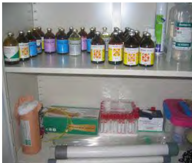
Gambar 10. Persediaan obat

Kuku sapi sebaiknya dipotong setiap 3-4 bulan sekali, dianjurkan untuk melakukan pemotongan kuku secara teratur, terutama kuku kaki bagian belakang. Sebab kuku kaki depan lebih keras dibandingkan bagian belakang yang selalu basah terkena air kencing dan kotoran. Tetapi dari segi kecepatan pertumbuhan, kuku kaki belakang maupun kaki depan