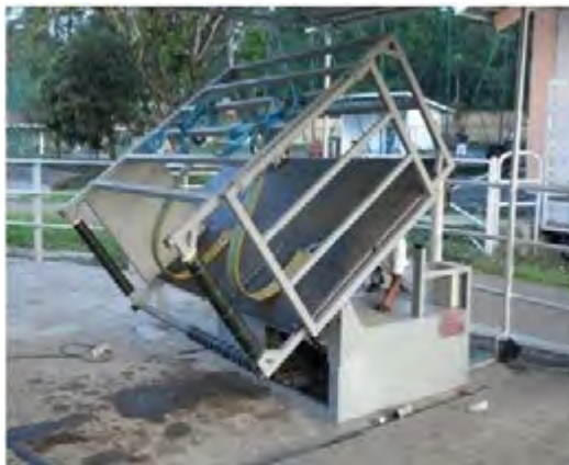
Gambar 12. Meja potong kuku sapi ( hoof trimming table )

Teknik Pemotongan Kuku Pada Sapi ( Hooves Trimming ). Kuku sapi yang tidak terpelihara akan sangat mengganggu karena dapat mengakibatkan kedudukan tulang teracak menjadi salah, sehingga titik berat badan jatuh pada teracak bagian belakang, bentuk punggung menjadi seperti busur, mudah terjangkit penyakit kuku, dan mengakibatkan kepincangan pada ternak. Kuku yang tumbuh panjang dapat menghambat aktivitas ternak, seperti naik turun kandang, berjalan untuk mendapatkan makanan dan minum, atau berdiri dengan baik sewaktu melakukan perkawinan. Di samping itu menyebabkan ternak sulit berjalan dan timpang, sehingga mudah terjatuh dan mengalami cedera. Apabila ternak tersebut sedang bunting, maka dapat mengakibatkan keguguran.