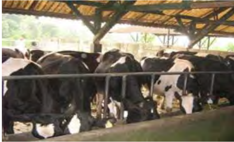
Gambar 18. Pemeliharaan Sapi Dewasa