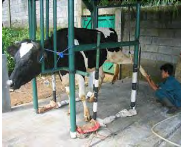
Gambar 8. Pemotongan Kuku di kandang jepit

Kuku yang tidak terpelihara akan sangat mengganggu karena dapat mengakibatkan kedudukan tulang tracak menjadi salah, sehingga titik berat badan jatuh pada teracak bagian belakang, bentuk punggung menjadi seperti busur, mudah terjangkit penyakit kuku, dan mengakibatkan kepincangan pada ternak. Kuku yang tumbuh panjang dapat menghambat aktivitas ternak, seperti naik-turun kandang, berjalan untuk mendapatkan makanan dan minum, atau berdiri dengan baik sewaktu melakukan perkawinan. Di samping itu menyebabkan ternak sulit berjalan dan timpang, sehingga mudah terjatuh dan mengalami cedera. Kalau ternak itu sedang mengalami kebuntingan, maka dapat mengakibatkan keguguran