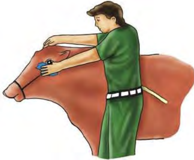
Gambar 16. Cara Memandikan Sapi

menyiramkan air di kepala sapi, pegang telinganya dan tekuklah. Cara memandikan sapi tertera pada Gambar 16.