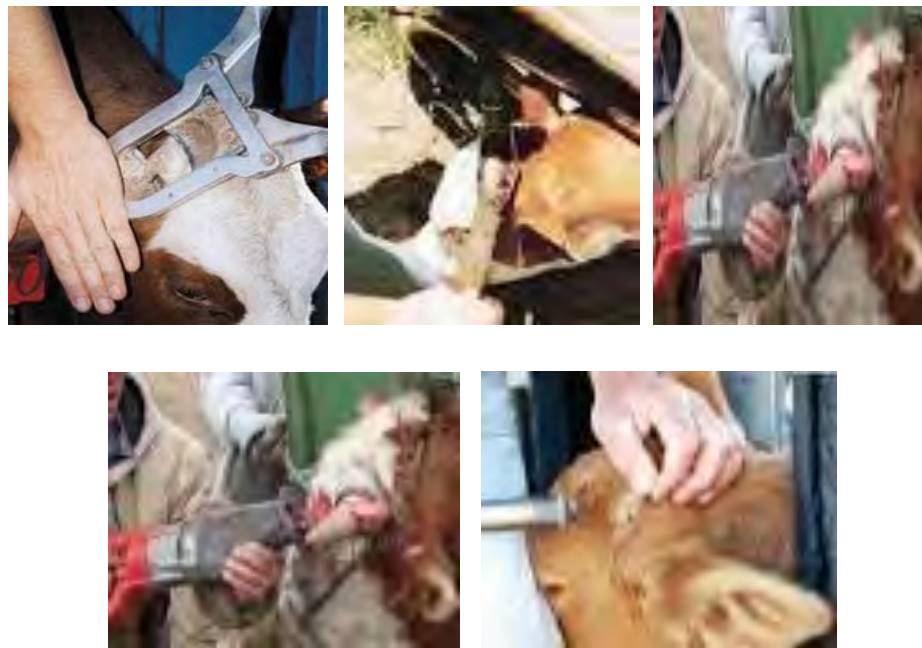
Gambar 14. Pemotongan tanduk sapi ( dehorning )

Tanduk sapi dapat dihilangkan dengan cara membunuh sel tumbuh pada ujung tanduk dengan bahan kimia. Bahan kimia yang sering digunakan adalah soda api. Kulit pada sekitar ujung tanduk diolesi dengan paselin untuk mencegah bagian lain terkena soda api, kemudian oleskan soda api pada ujung tanduk sapi. Sel tumbuh pada ujung tanduk akan mati dan tanduk tidak tumbuh lagi.