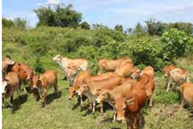
Gambar 1. Sapi Bibit

Usaha peternakan sapi potong di Indonesia sebagian besar adalah penggemukan, dan sangat sedikit yang bergerak di bidang pembibitan. Hal ini terkait dengan kurangnya insentif ekonomi dalam usaha pembibitan.