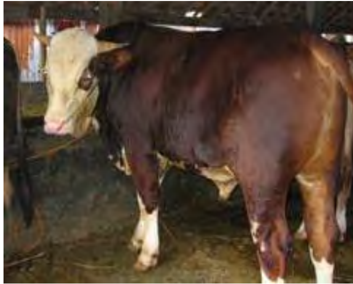
Gambar 6. Pemeliharaan Sapi Pejantan

Pelepasan pejantan di lapangan adalah perlu sekali untuk menjamin kesehatan kuku sapi, di samping itu guna menjaga kondisi badan sapi pejantan supaya tetap baik, khususnya bila pejantan tersebut banyak dipakai untuk perkawinan. Sapi-sapi jantan hendaknya dipelihara di kandang terpisah dari sapi-sapi betina untuk mencegah hal-hal yang tak diinginkan.