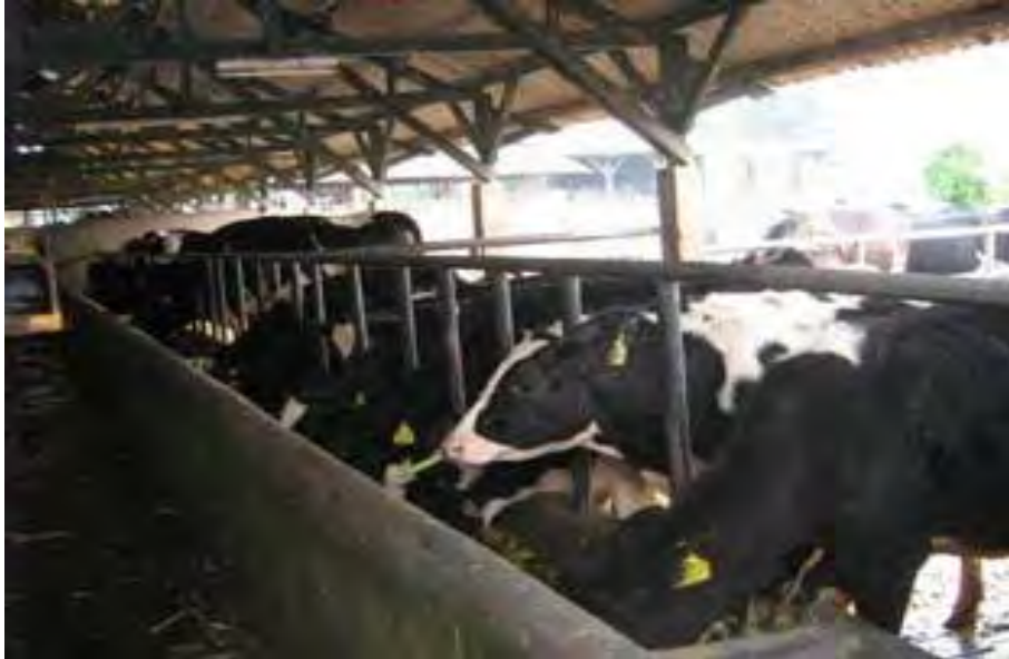
Gambar 11. Kandang Koloni untuk Sapi Dara

Pemotongan Kuku Sapi. Pemotongan kuku sapi ini dilakukan untuk menjaga kesehatan ternak dengan menghindari atau mencegah kemungkinan terjadinya peradangan akibat dari kotoran yang melekat pada celah-celah kuku. Pemotong kuku terutama diperuntukkan pada ternak yang terus menerus dipelihara di dalam kandang.