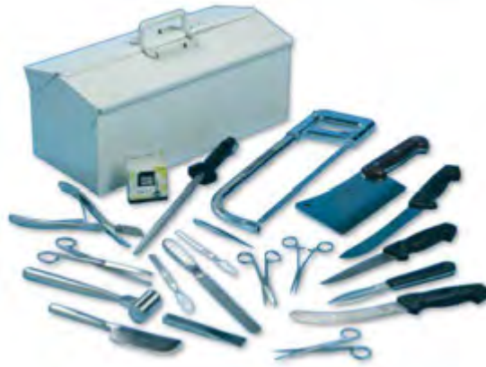
Gambar 5. alat pemotong kuku

Pemotongan kuku sapi ini dilakukan untuk menjaga kesehatan ternak dengan menghindari atau mencegah kemungkinan terjadinya peradangan akibat dari kotoran yang melekat pada celah-celah kuku. Pemotong kuku terutama diperuntukkan pada ternak yang terus menerus dipelihara didalam kandang. Ternak sapi yang dikandangkan secara terus menerus (tempat terbatas) biasanya pertumbuhan kuku lebih cepat daripada yang digembalakan. Kuku yang panjang jangan dibiarkan tidak baik, karena dapat mengganggu jalannya ternak, kuku dapat patah dan mengakibatkan infeksi, dibawah telapak kuku biasanya berongga dan penuh kotoran yang ditumbuhi kuman penyakit yang membahayakan kesehatan. Sebaiknya kuku dipotong secara rutin, kalau terlalu lama dibiarkan menjadi keras dan sulit memotongnya. kuku dapat dipotong dengan menggunakan tатаh/pahat.