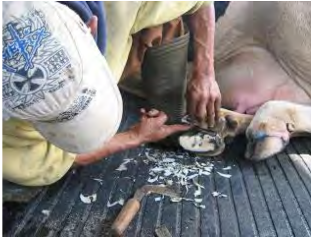
Gambar 9. Potong kuku secara manual