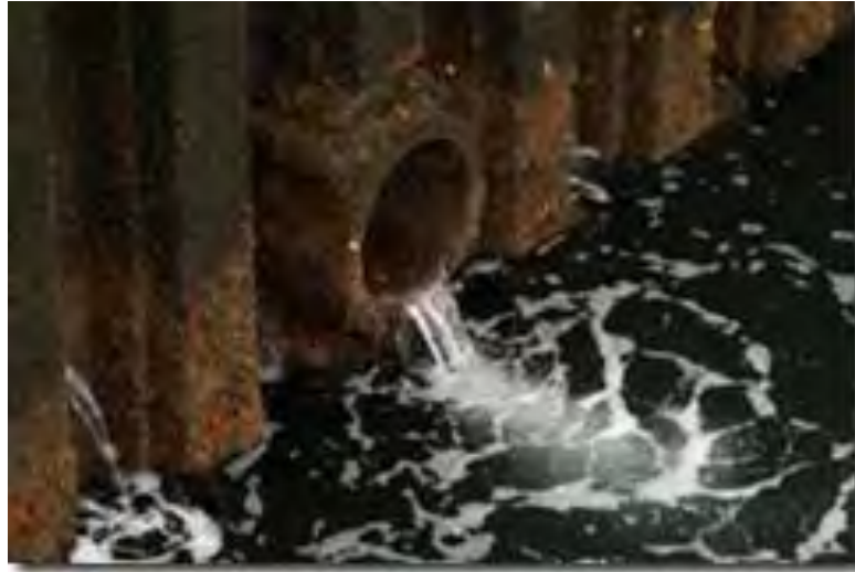
Gambar 3. Pencemaran air sungai

pencucian, atau bekas detergent jangan langsung dibuang ke selokan karena akan mencemari air selokan lainnya dan juga badan sungai tapi terlebih dahulu diadakan penyaringan air detergent tersebut