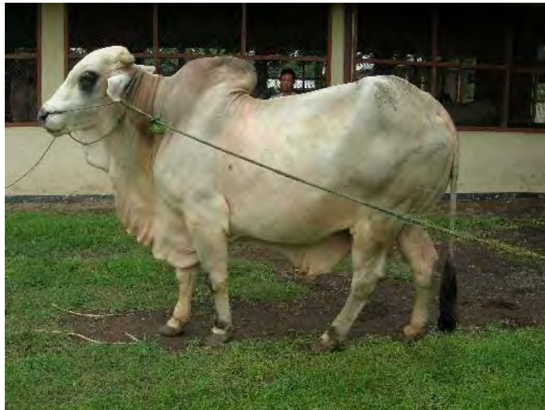
Gambar 19. Sapi pejantan sedang exercise

berontak atau beringas selain itu ternak mengalami ketakutan. Handling merupakan usaha penanganannya ternak semudah mungkin memperlancar segala aktifitas yang dilakukan peternak. Handling dilakukan untuk mencegah gerakan yang menyebabkan kaget. Kegaduhan di dalam kandang harus dicegah dan dihindari. Menurut Williamsons dan Payne (1993), handling dilakukan tidak kasar tetapi tegas. Saat berdiri disamping sapi diusahakan tidak berdiri disamping kaki belakang. Hal tersebut untuk menghindari sepakan sapi. Perhatian ternak harus dialihkan supaya tidak menimbulkan gerakan-gerakan yang menimbulkan kesulitan saat aktivitas dilakukan.