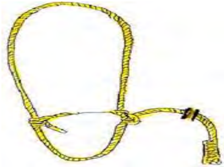
Gambar 20. Tali Halter

Tali halter biasanya digunakan untuk menuntut atau memindahkan ternak sapi/kerbau agar lebih mudah dikendalikan atau dijinakkan (Gambar 20).