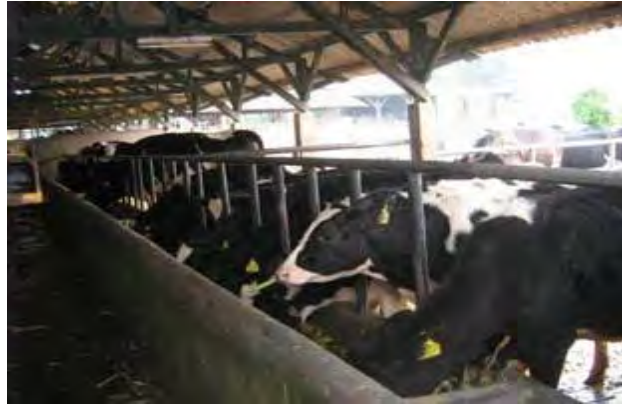
Gambar 17. Kandang Koloni untuk Sapi Dara