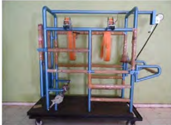
Gambar 13. Mesin potong kuku ( vet tracto tech )

Upaya untuk menjaga agar kedudukan kuku tetap serasi, maka setiap 3-4 bulan sekali dianjurkan untuk melakukan pemotongan kuku secara teratur, terutama kuku kaki bagian belakang. Hal ini karena kuku kaki depan lebih keras dibandingkan bagian kuku kaki belakang yang selalu basah terkena air kencing dan kotoran. Tetapi dari segi kecepatan pertumbuhan, kuku kaki belakang maupun kaki depan memiliki kecepatan tumbuh yang sama, sehingga baik kuku belakang maupun kuku kaki depan perlu dilakukan pemotongan secara teratur.