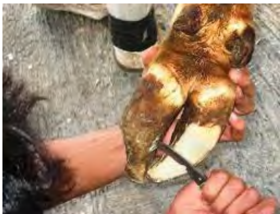
Gambar 4. kuku serta alat pemotongannya

Kuku sapi dipotong dengan alat pemotong (hoof trimmer) melingkar sekeliling kuku dari belahan kuku depan mengarah ke belakang. Pemotongan kuku ini dilakukan dengan hati-hati agar tidak sampai melebihi garis putih (white line) kuku. Bila pemotongan melebihi garis putih kuku maka lapisan coronarius yang mengandung banyak pembuluh darah dan syaraf akan terlukai. Seandainya hal ini terjadi, sapi akan merasa kesakitan dan terjadi perdarahan. Oleh karena itu, dalam melakukan pemotongan kuku cukup dengan menghilangkan bagian-bagian yang abnormal saja. Apabila tidak terdapat alat pemotong kuku khusus, pemotongan kuku dapat dilakukan dengan memakai pahat atau tang penggunting (kakatua) yang tajam.