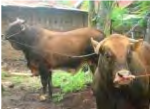
Gambar 2. Bibit sapi potong

Beternak dengan memelihara induk dan pejantan yang tujuannya adalah menghasilkan anak, dibesarkan dan kemudian dijual. Biasanya tidak semua peternak memiliki pejantan,